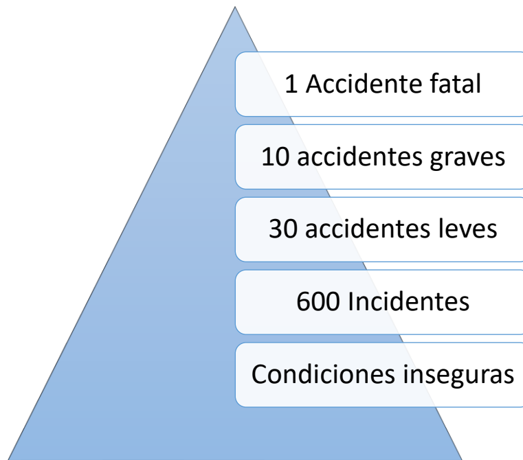
Gráfico 2 Pirámide de Bird