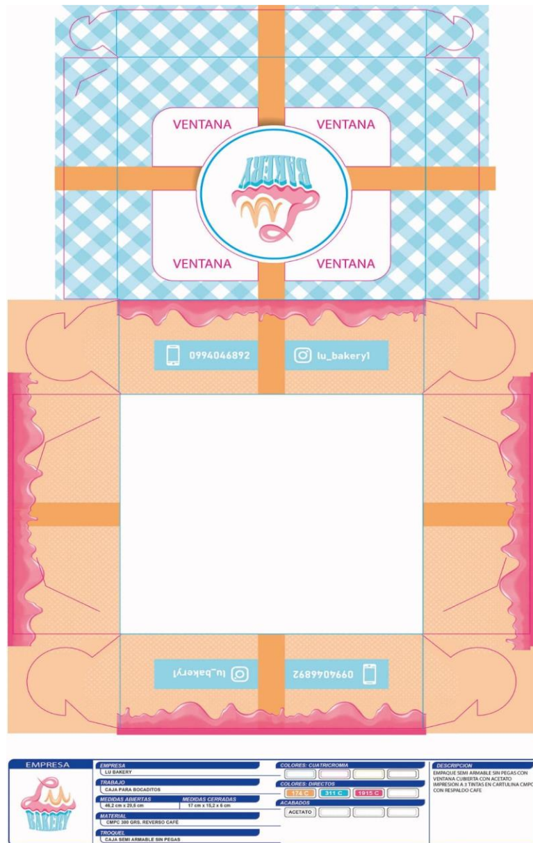
Ilustración 4 Caja Bocaditos