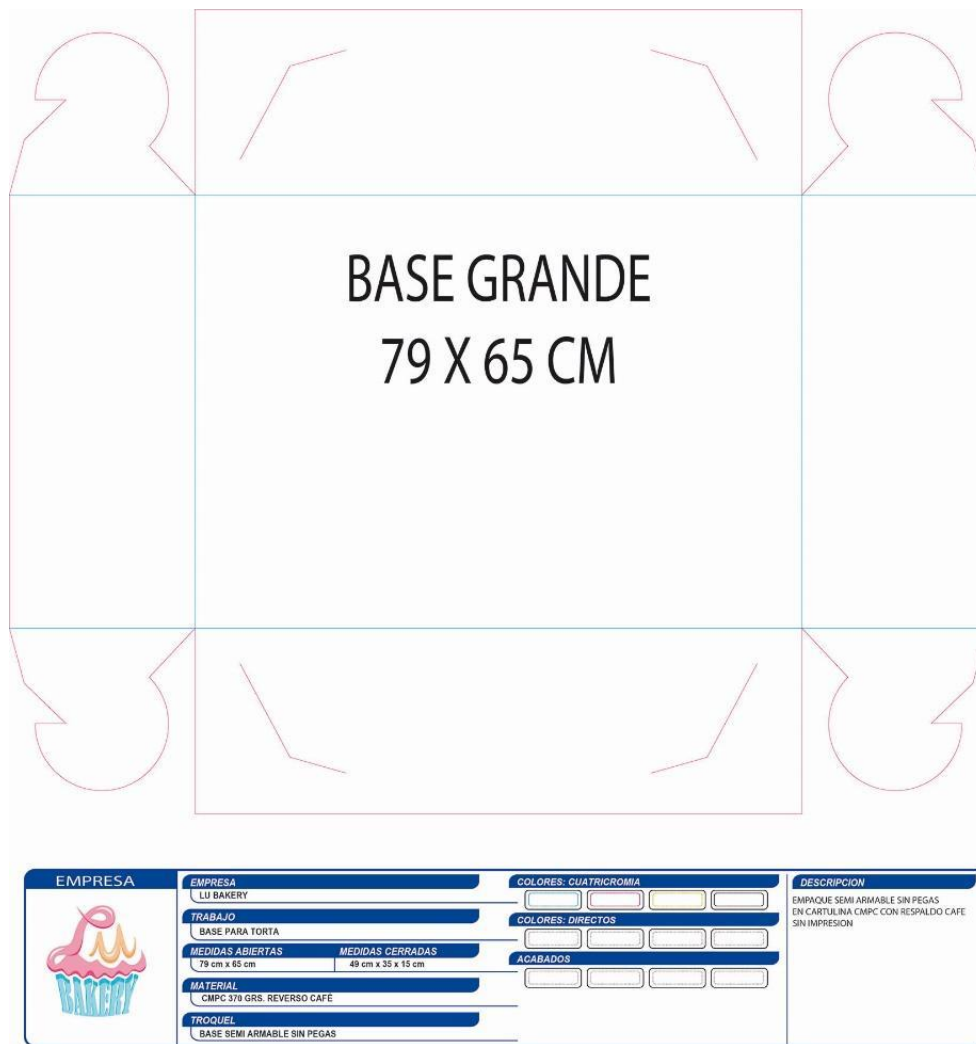
Ilustración 2 Base Torta