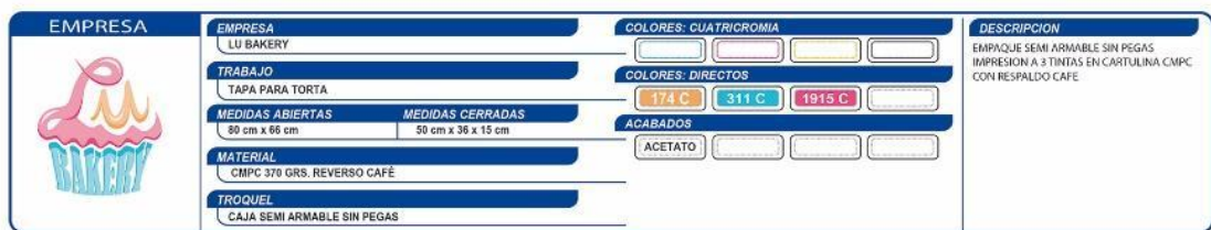
Ilustración 1 Tapa Torta