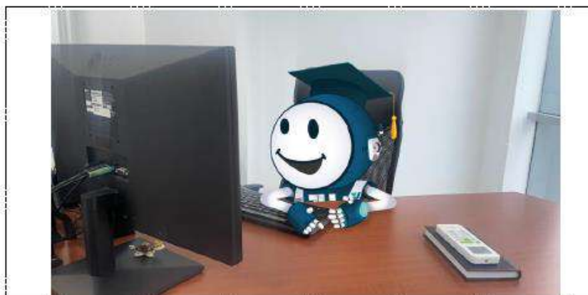
Imagen 1. Actividades realizadas por UFITO

Imágenes en las que se puede evidenciar las actividades realizadas por los estudiantes (mínimo 4 fotos: dos en el área desempeñada y 2 bajo la supervisión del Tutor Empresarial)