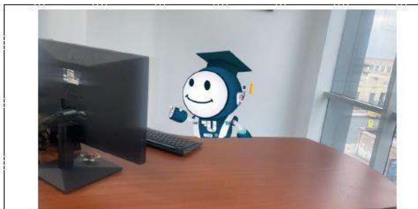
Imagen 2. Funciones desempeñadas por UFITO