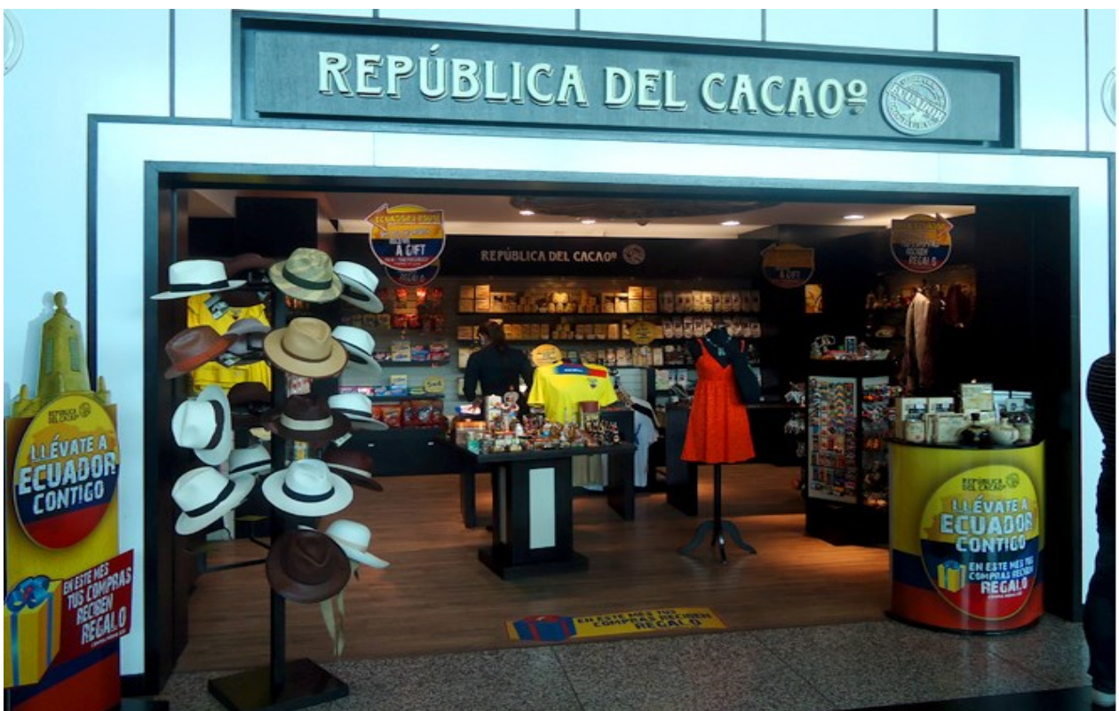
5.4 Lugares de compras en prendas de vestir y artesanías de nuestro Ecuador.