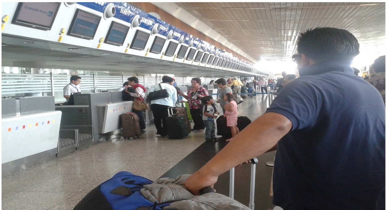
5.1 En espera de la atención para el registro del pasaporte y la entrega del ticket para ingresar a su vuelo