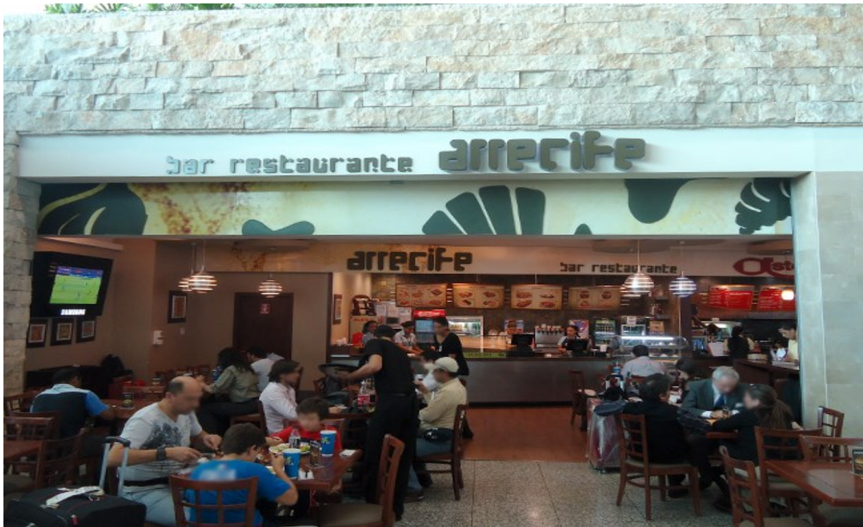
5.3 Variedades de restaurantes, para los viajeros en espera de sus vuelos.