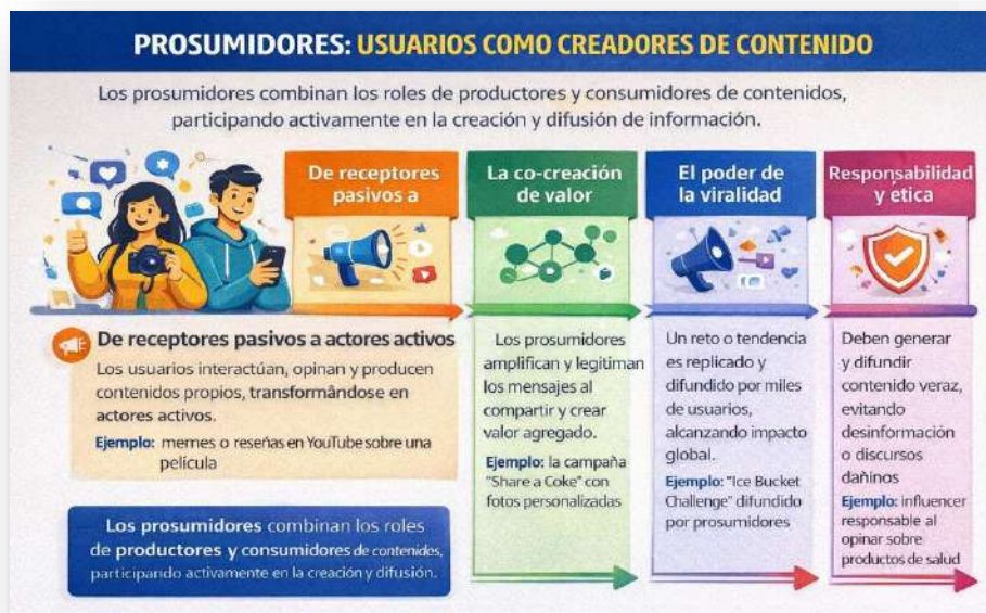
Figura 5. Prosumidores. Nota: elaborado por el autor con IA (2026)