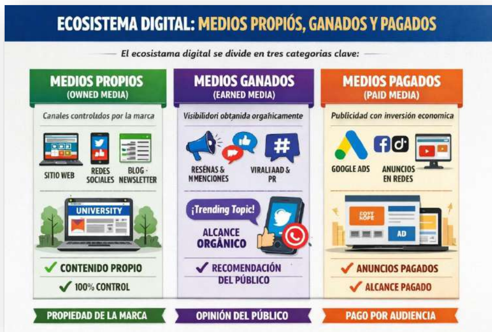
Figura 3. Ecosistema digital. Nota: elaborado por el autor con IA (2026)