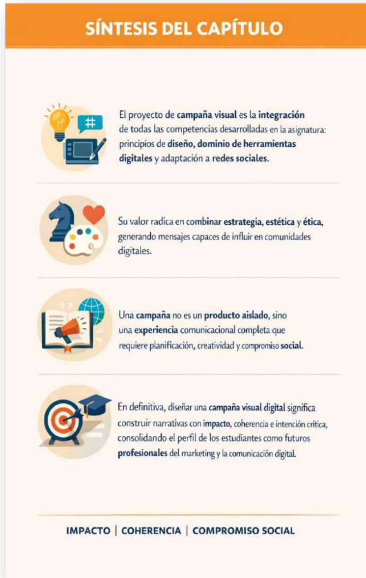
Figura 22. Resumen de capítulo. Nota: elaborado por el autor con IA (2026)

En definitiva, diseñar una campaña visual digital significa construir narrativas con impacto , coherencia e intención crítica , consolidando el perfil de los estudiantes como futuros profesionales del marketing y la comunicación digital.