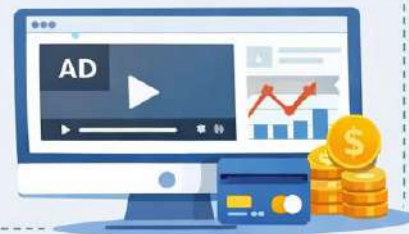
Figura 12. CREATOR STUDIO. Nota: elaborado por el autor con IA (2026)