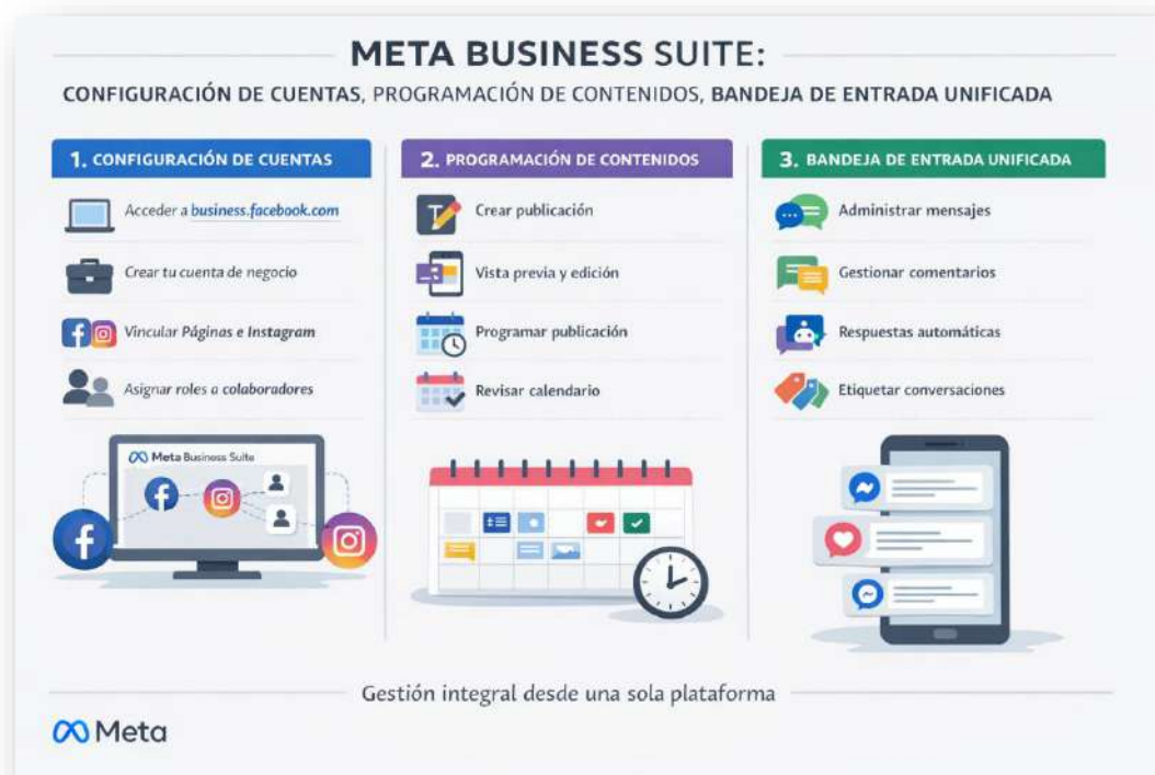
Figura 11. META BUSINESS SUITE. Nota: elaborado por el autor con IA (2026)