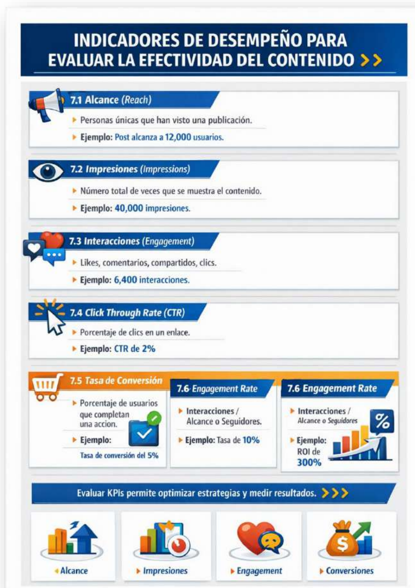
Figura 20. Indicadores de desempeño. Nota: elaborado por el autor con IA (2026)

c. Interpretación: permite evaluar la rentabilidad del contenido y justificar la inversión publicitaria.