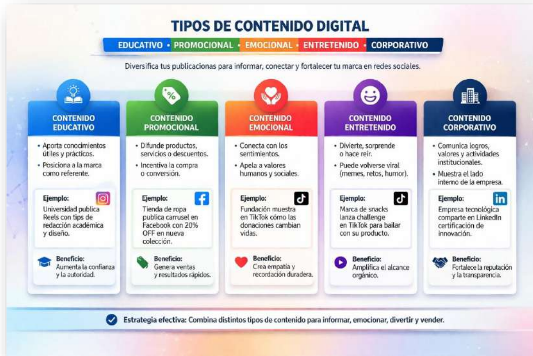
Figura 16. Contenidos. Nota: elaborado por el autor con IA (2026)

sino que también eduque, inspire, divierta y construya relaciones sólidas con su comunidad digital.