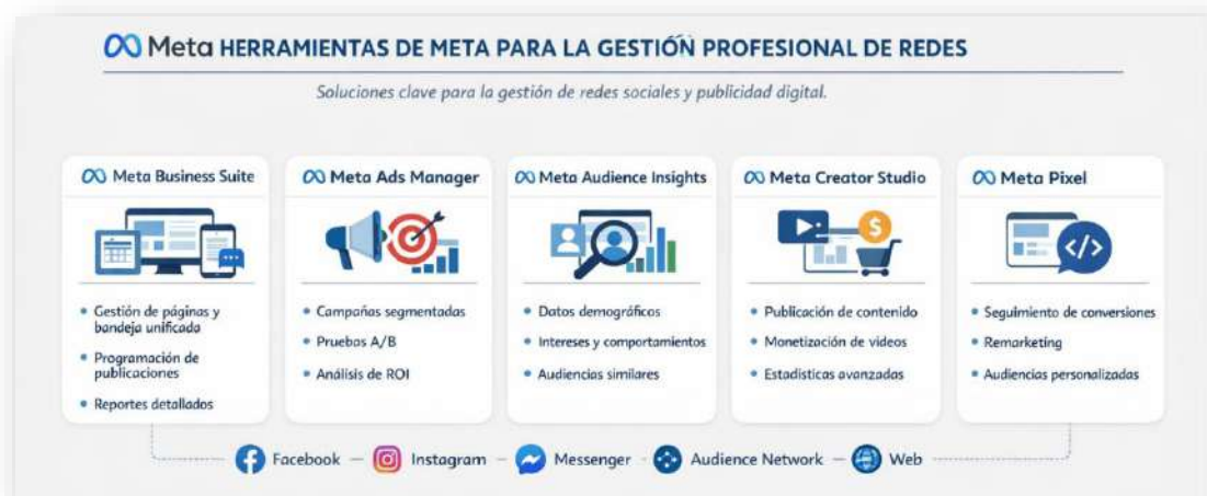
Figura 10. Herramientas META. Nota: elaborado por el autor con IA (2026)

Ejemplo técnico: una tienda online instaló el Meta Pixel en su sitio web. Gracias a ello, pudieron mostrar anuncios de remarketing a usuarios que habían agregado productos al carrito, pero no completaron la compra. Esto aumentó la tasa de conversión en un 25%.