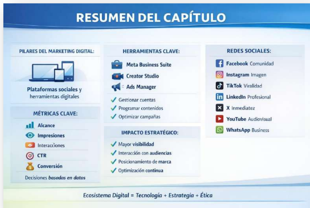
Figura 14. Resumen del capítulo. Nota: elaborado por el autor con IA (2026)

Cada red social (Facebook, Instagram, TikTok, LinkedIn, X, YouTube y WhatsApp Business) cumple un rol específico en la construcción de comunidades y el posicionamiento de marca. Estas herramientas no solo maximizan la visibilidad y la interacción, sino que también facilitan la toma de decisiones basada en datos. En conjunto, forman un ecosistema que potencia la gestión profesional y ética de la comunicación digital.