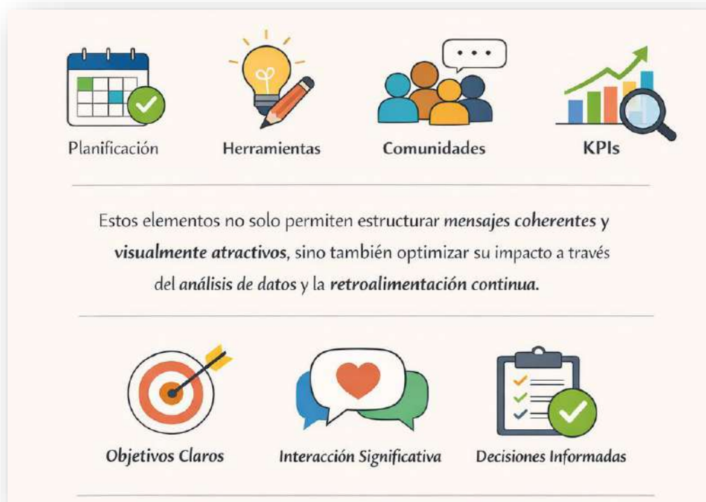
Figura 21. Resumen de capítulo. Nota: elaborado por el autor con IA (2026)

Asimismo, se evidencia que el éxito en entornos digitales no depende únicamente de la creatividad, sino de la capacidad para articular estrategias basadas en objetivos claros, interacción significativa con las audiencias y toma de decisiones informadas, consolidando así una comunicación efectiva, sostenible y alineada con las dinámicas del ecosistema digital contemporáneo