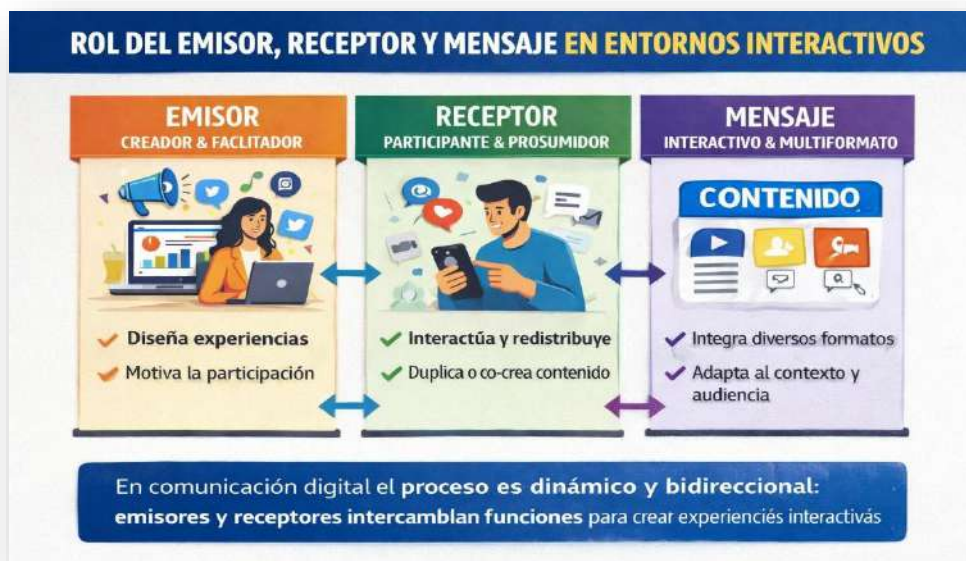
Figura 4. Roles. Nota: elaborado por el autor con IA (2026)

El mensaje digital no es unidimensional, sino que integra texto, imágenes, audio, video, enlaces e interactividad. Su valor no radica únicamente en lo que comunica, sino en la forma en que invita al receptor a interactuar, responder o compartir. Además, el mensaje se adapta al contexto de la plataforma y a los hábitos de consumo de la audiencia. Ejemplo: un mismo lanzamiento de producto puede presentarse como un video corto en TikTok, una infografía en Instagram y un artículo más extenso en el blog corporativo, respondiendo a los formatos preferidos de cada comunidad digital.