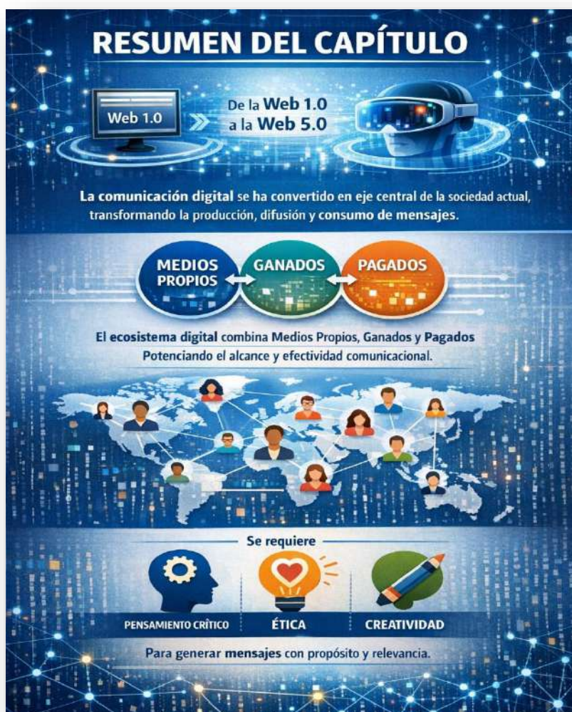
Figura 7. Resumen del capítulo. Nota: elaborado por el autor con IA (2026)

El ecosistema digital integra medios propios, ganados y pagados, que al combinarse potencian el alcance y la efectividad de las estrategias comunicacionales. Estos cambios no solo impactan en el marketing, sino también en la cultura y las relaciones sociales, configurando comunidades globales conectadas. En este contexto, la comunicación digital exige pensamiento crítico, ética y creatividad para generar mensajes con propósito y relevancia.