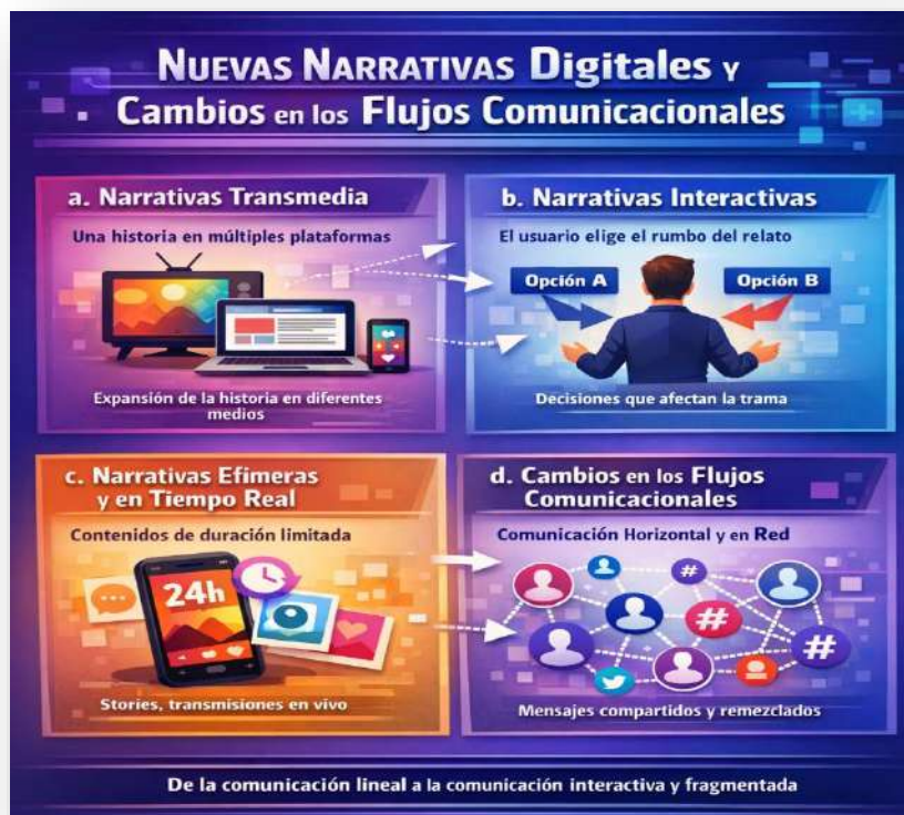
Figura 6. Nuevas narrativas digitales. Nota: elaborado por el autor con IA (2026)

Los flujos tradicionales de comunicación seguían un esquema vertical: del emisor al receptor. Hoy, los flujos son horizontales, múltiples y descentralizados. Los usuarios pueden ser emisores, receptores y replicadores de mensajes de manera simultánea. Además, el mensaje no se detiene en la recepción, sino que circula en red, generando nuevas capas de significado. Ejemplo: una noticia publicada por un medio digital puede ser compartida, comentada y remezclada en Twitter/X, generando debates y reinterpretaciones que van más allá del mensaje original.