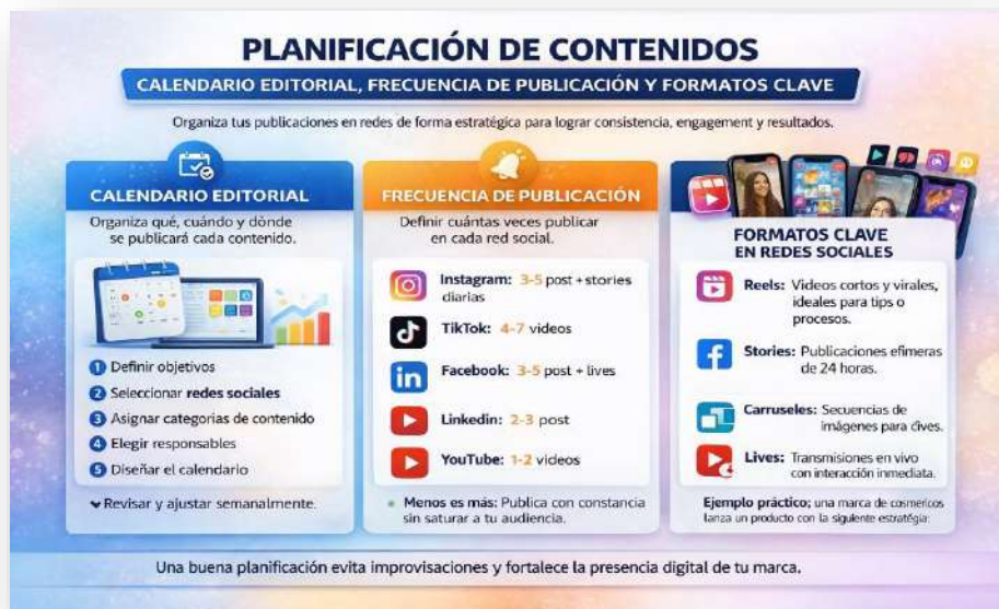
Figura 17. Planificación. Nota: elaborado por el autor con IA (2026)