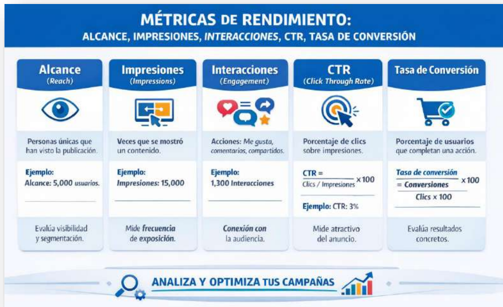
Figura 13. Métricas. Nota: elaborado por el autor con IA (2026)