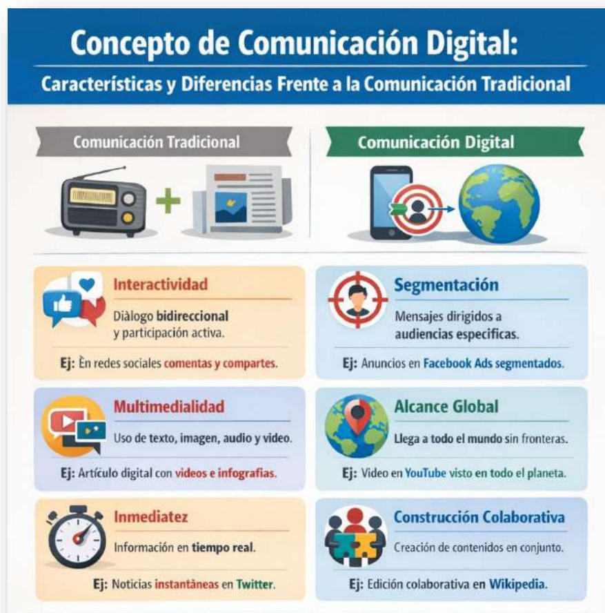
Figura 1. Concepto comunicación digital. Nota: elaborado por el autor con IA (2026)

Estas características no solo transforman la manera de comunicar, sino también los roles de emisores y receptores, consolidando un nuevo paradigma en el intercambio de información. Ejemplo: un banner publicitario de lanzamiento destaca primero el nombre del producto y luego, en menor jerarquía, la promoción o el descuento.