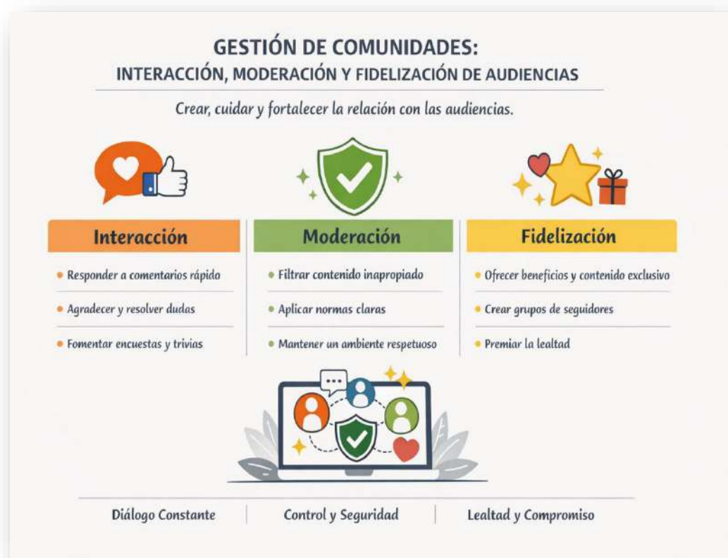
Figura 19. Gestión de comunidades. Nota: elaborado por el autor con IA (2026)