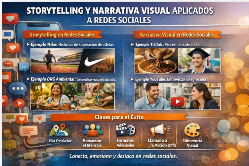
Figura 15. Storytelling. Nota: elaborado por el autor con IA (2026)

efectivo para consolidar la identidad, fortalecer el engagement y diferenciarse en el mercado digital.