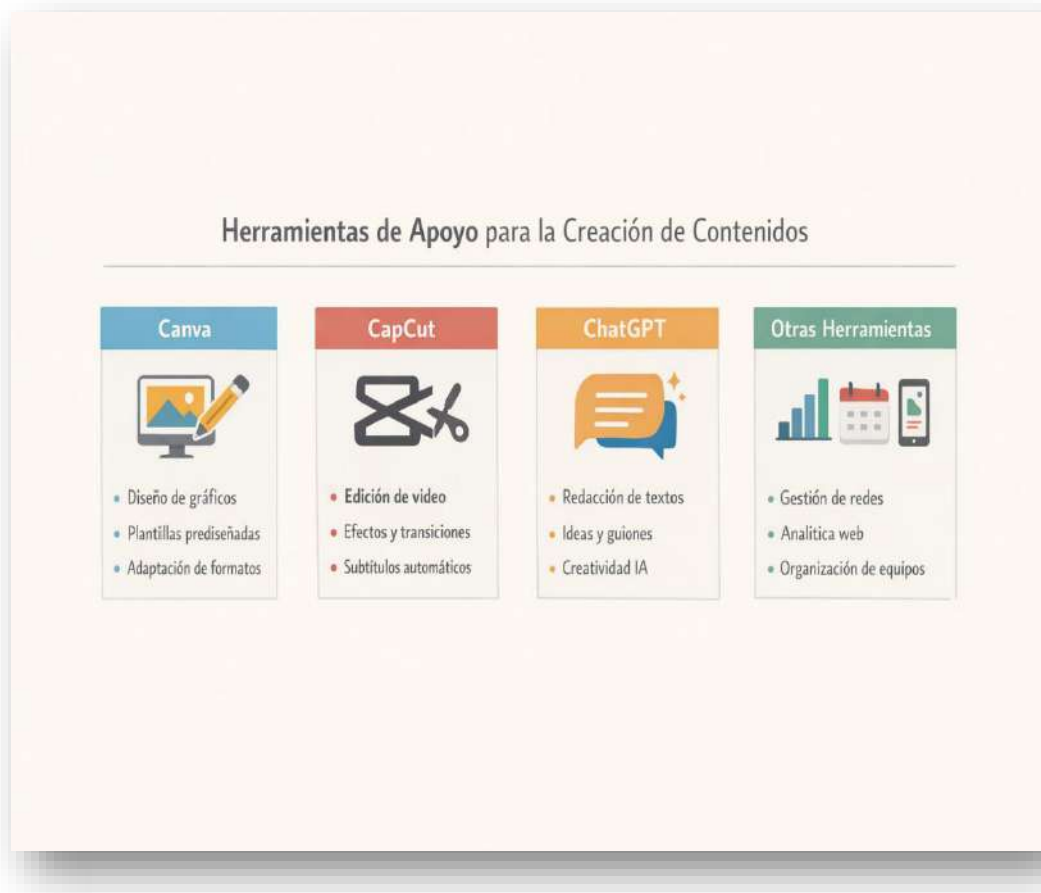
Figura 18. Herramientas de apoyo. Nota: elaborado por el autor con IA (2026)