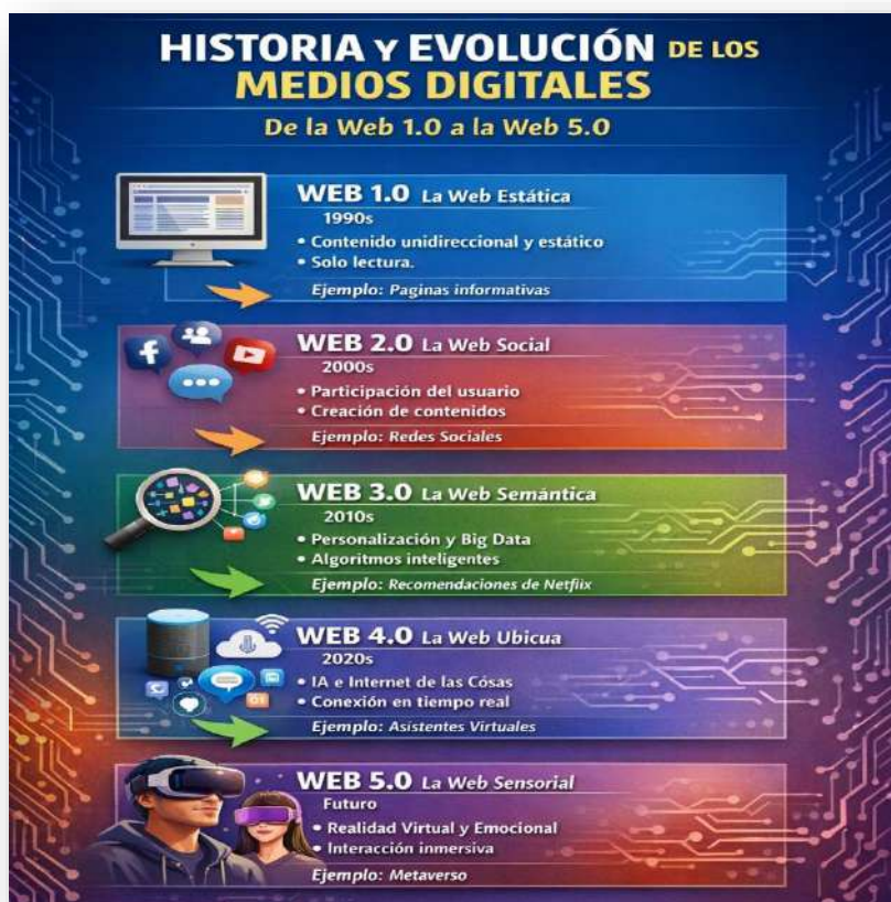
Figura 2. Historia y evolución. Nota: elaborado por el autor con IA (2026)

Efectivamente, la evolución de la Web desde la 1.0 hasta la 5.0 refleja un tránsito desde la mera exposición de información hacia la construcción de espacios interactivos, personalizados y emocionales. Cada etapa ha supuesto un cambio de paradigma en la comunicación digital, ampliando no solo las posibilidades tecnológicas, sino también las formas de relación entre individuos, comunidades y organizaciones.