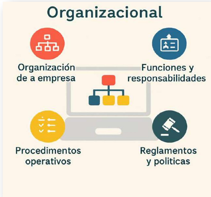
Figura 1. Estructura de los MIPYMES

En el caso de las MIPYMES, el valor del manual organizacional es aún mayor, ya que muchas de estas unidades carecen de herramientas formales para guiar su operación interna.